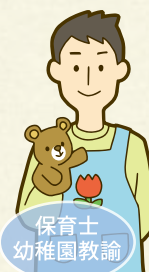
保育士 幼稚園教諭

医学、食品学、栄養・調理学、保育などで活躍中の全国トップレベルの講師陣が最新情報満載の教材をお届けします。アレルギー対応のスキルアップのチャンスです。