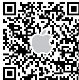
↑ iPhone はこちら