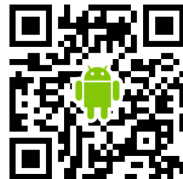
↑ iPhone 以外はこちら